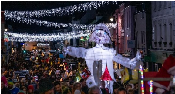
E. Drabble c/gan Gorymdaith Llusernau'r Nadolig Facebook)

Sicrhodd y Cynghorwyr newydd fod Gorymdaith Llusernau'r Nadolig yn dychwelyd yn 2022 gyda nifer o'r Aelodau newydd yn cymryd rhan arweiniol o'r sefydliad ynghyd ag aelodau'r gymuned sydd bob amser wedi bod yn rhan allweddol o'r digwyddiad. Y thema eleni oedd "Hanes Trefynwy" a gefnogwyd yn wych gan y trigolion lleol gyda'u llusernau. Trefnodd a chynhaliodd y gweithgor weithdai rhad ac am ddim a oedd yn galluogi trigolion i wneud eu llusernau gyda deunyddiau a ddarparwyd